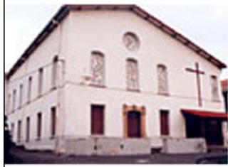
K4 /P2.- BETARRAMITAK