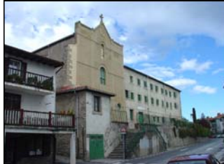
K5 / P3.- KAPUTXINOAK